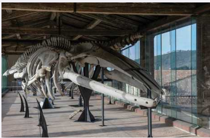
Musei Università di Pisa

Sono aumentate del 25% le visite ai musei Università di Pisa: sono stati quasi 190 mila i visitatori del 2018.