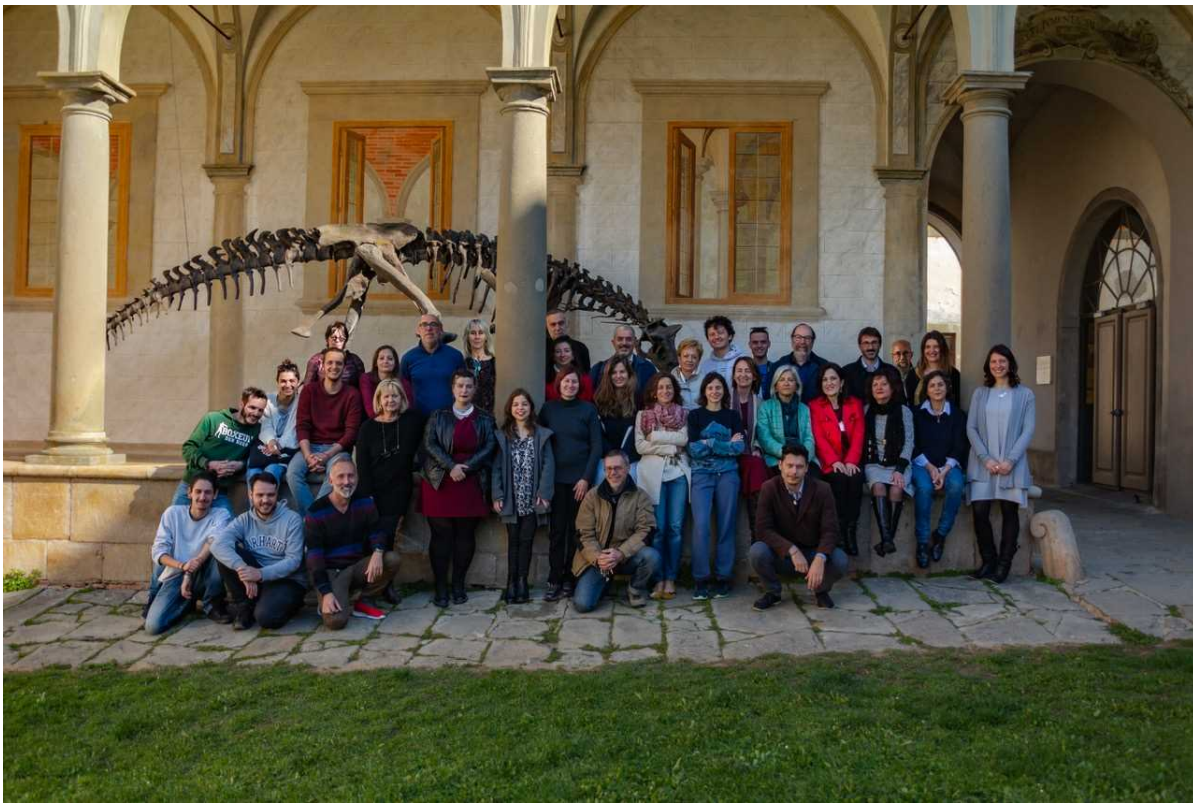
Il personale del Museo di Calci.