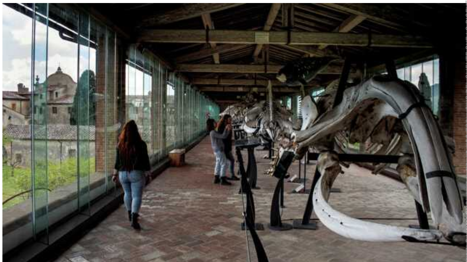
La galleria dei cetacei del Museo di Storia naturale