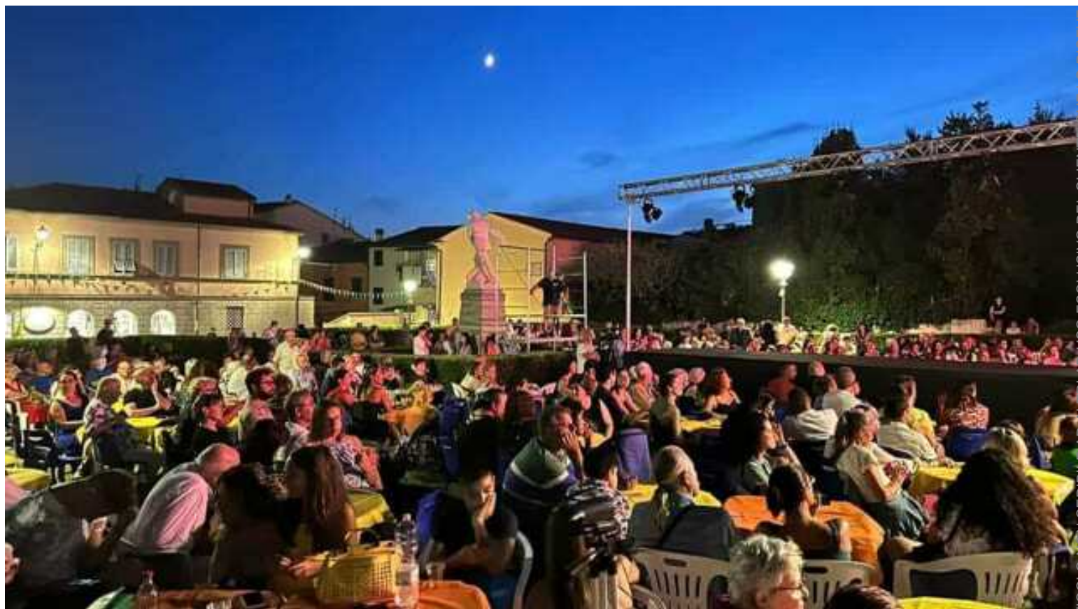
Un evento a Calci

ARTICOLO NON CEDIBILE AD ALTRI AD USO ESCLUSIVO DEL CLIENTE CHE LO RICEVE - 7943