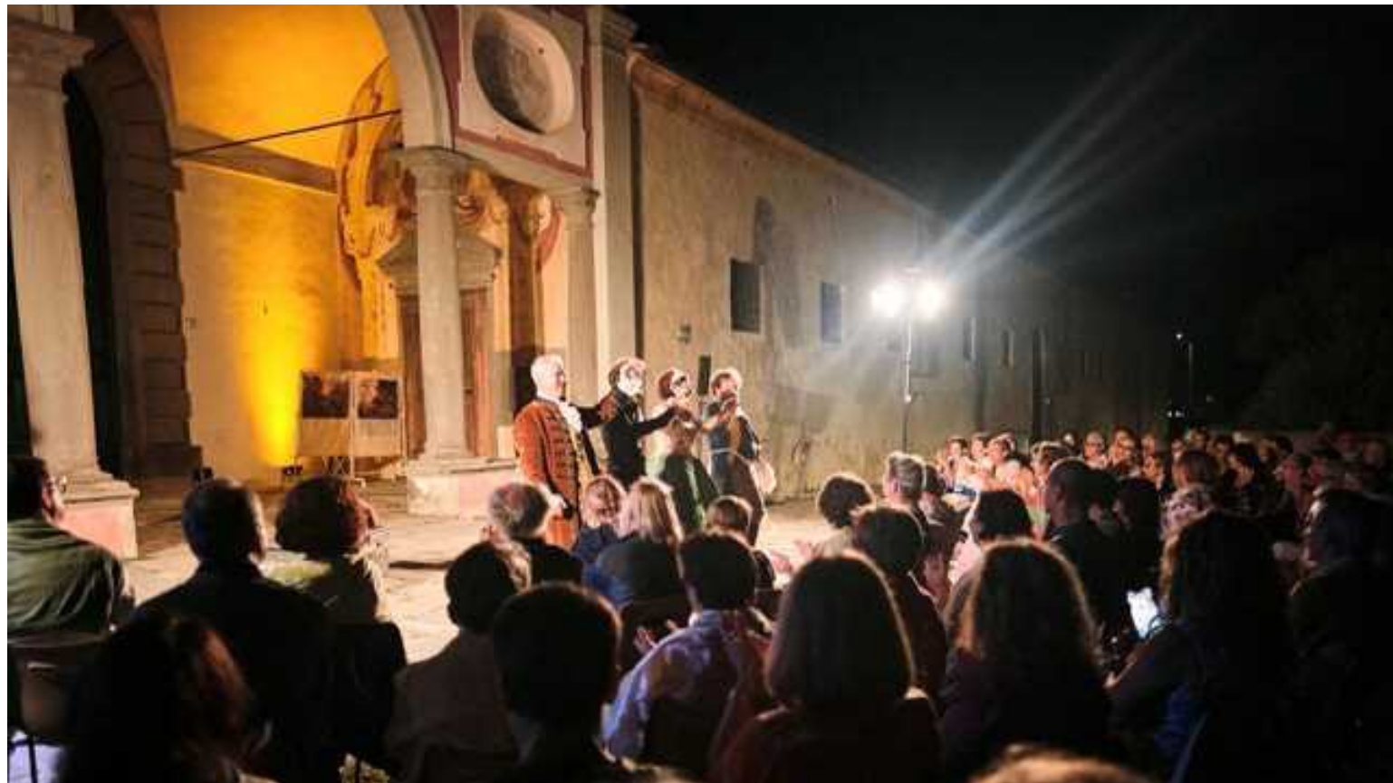
Un odegli eventi del Monte Pisano Art Festival

S uccesso per l'edizione 2023 del Monte Pisano Art Festival che ha affascinato il pubblico con dieci giorni di intrattenimenti musicali e artistici, svolti nei 5 comuni coinvolti, attirando oltre 2.000 partecipanti, tra turisti italiani e stranieri e residenti, registrando un tutto esaurito per tutti gli eventi in programma.