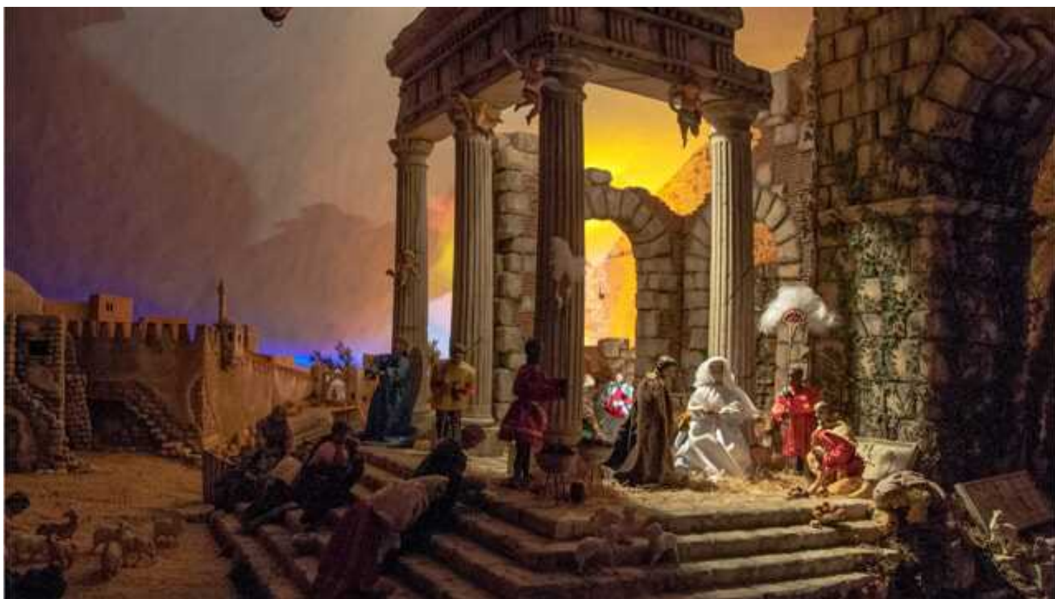
Presepi Meucci

La Valgraziosa conta ben tre presepi aderenti a Terre di Presepi , la rete che unisce e coordina i numerosi presepi in Toscana e in Italia. Ciascuno con le sue peculiarità ed originalità, sono 'Il Presepio che cresce' di Nicosia, giunto alla 25ª edizione, il 'Presepe del Santuario della Madonna delle Grazie a Tre Colli' e i 'Presepi storici meccanici dei Meucci', oggi custoditi ed esposti dal Museo di Storia Naturale dell'Università di Pisa, nella Certosa di Calci.